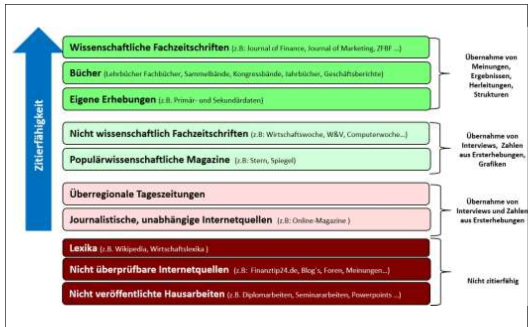
Abbildung 2: Zitierfähigkeit von Quellen (Eigene Darstellung)

Auch wenn Zeit einen Engpassfaktor darstellt, sollte wegen des Einflusses der Literaturrecherche auf die Qualität der Argumentation ausreichende Zeitressourcen investiert werden. Vor allem sollte der Zeitbedarf für die Literaturbeschaffung nicht unterschätzt werden. Insbesondere wird übersehen, dass nicht die komplette benötigte Literatur in der Duisburg-Essener Universitätsbibliothek (eventuell als Digitalversionen) vorhanden ist und dort zur sofortigen Ausleihe bereitsteht. Fernleihen und das Vormerken von Büchern erfordern mitunter mehrere Wochen Wartezeit.